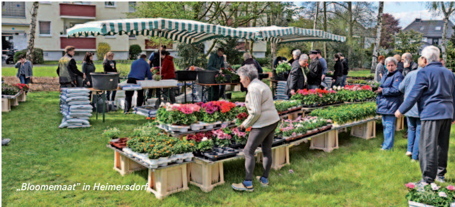
„Bloomemaat“ in Heimersdorf