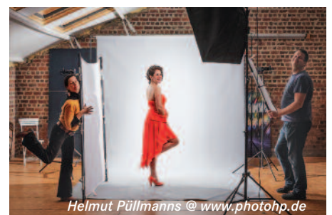
Helmut Püllmanns @ www.photohp.de

Ab Anfang April stellt Herr Helmut Püllmanns neue Fotoarbeiten in unserer Geschäftsstelle aus. Sie können zu den gewöhnlichen Öffnungszeiten gerne betrachtet werden.