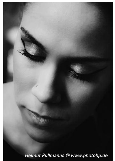
Helmut Püllmanns @ www.photohp.de

Ab Anfang April stellt Herr Helmut Püllmanns neue Fotoarbeiten in unserer Geschäftsstelle aus. Sie können zu den gewöhnlichen Öffnungszeiten gerne betrachtet werden.